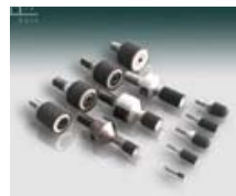
ビトリファイト CBN 砥石 研磨ヘッド