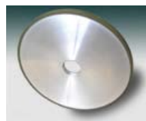
レジンボンド ダイヤモンド、 CBN 砥石

砥石の中国製品の輸入は、以前からタブーな分野となっている。焼結技術から振れ精度の要求、砥粒とボンドの品質、直接砥石の寿命と加工精度等、確認要素が多い為なかなか輸入しにくい商品として認識されている。中国の有力メーカー数社を考察し、タイアップを図り、各砥石メーカーの強い分野を組み合わせでプライベートブランドとしての発売を検討している。生産ラインでの砥石切り替えリスクが大きい為、工場保全課をターゲットとした。工具研磨と補完部品の研磨で使うダイヤモンドとcBN砥石の切り替えが多い。