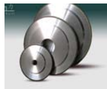
NC研削盤専用精密砥石